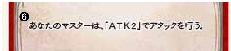
スキル / アーツ