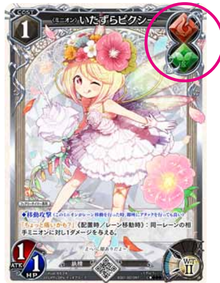
ダブルシンボルのカード