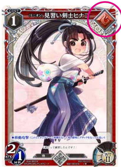
シングルシンボルのカード

カラーシンボルを1つ持つカードをシングルシンボルのカード、2つ持つカードをダブルシンボルのカードと呼びます。